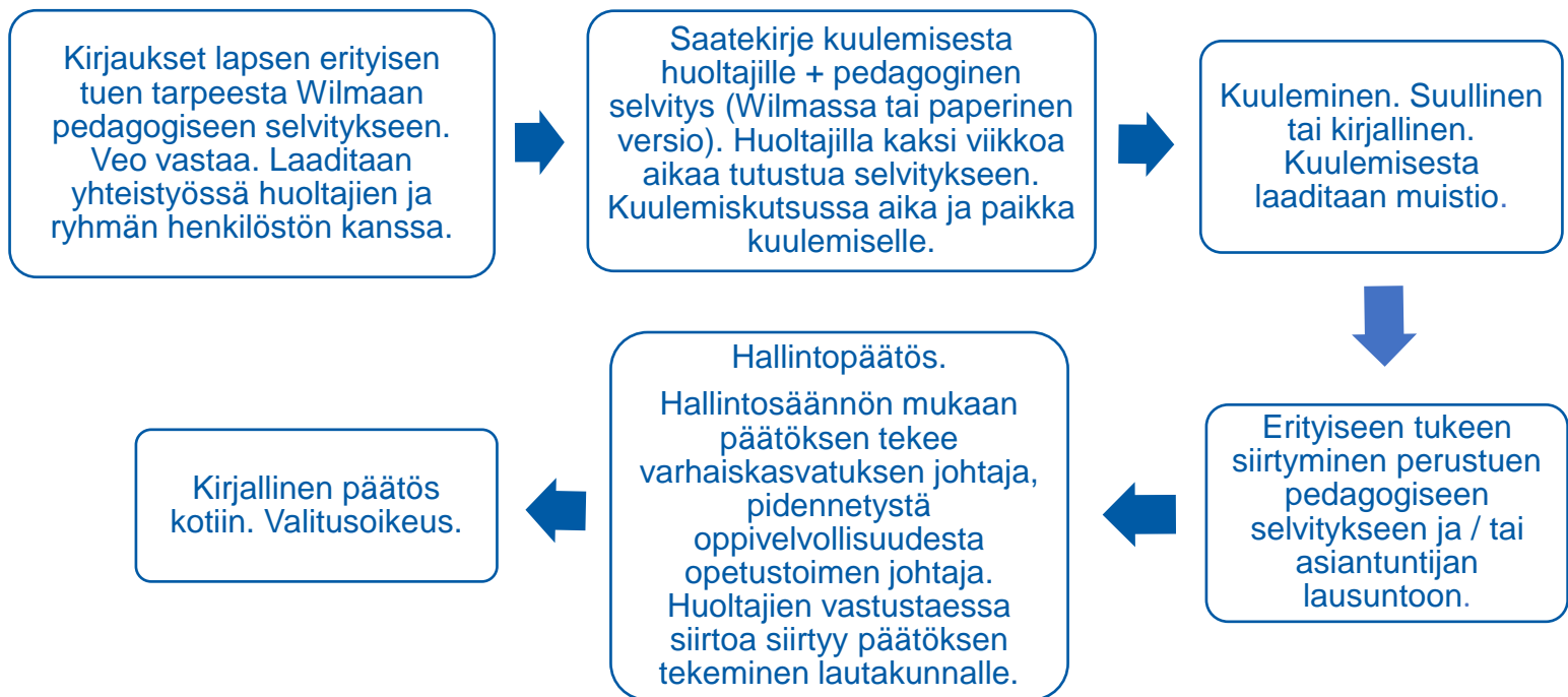
Kaavio: Huoltajien kuuleminen Uudenkaupungin esiopetuksessa – erityinen tuki