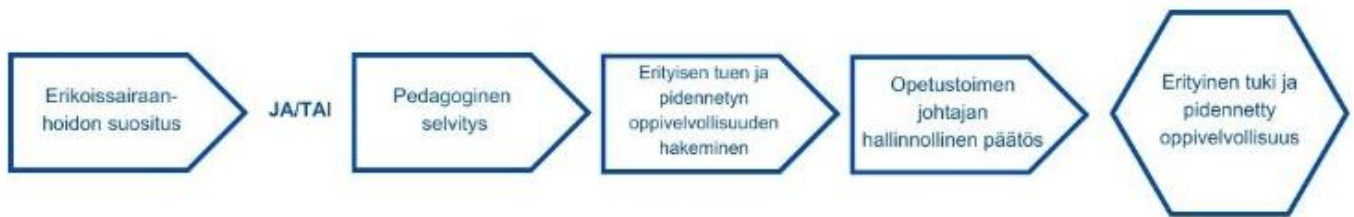
Kuvio 4: Pidennetyt oppivelvollisuuden hakeminen ja päätöksen teko Uudessakaupungissa